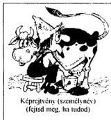
Képrejtvény (személynév) (fejtsd meg, ha tudod)

Robin, a Bátor, elszaladt... - Nem! Bátrán elfutott, el ő - Nem én! A vész lattán, ahogy tudott. Farkát behúzza elfutott - Nem! Jó messzire, s ma szakadt, Műdön nyulként, bátrán szaladt - Nem! Előre csak lassan jutott - Nem én! Mert közben többször elcsuszott... - Hazugság! A bátrak bátra hej, Sir Robin! - Soha!